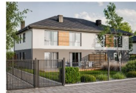
Widok budynku od przodu