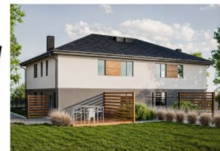
Widok budynku od tyłu