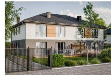
Widok budynku od przodu