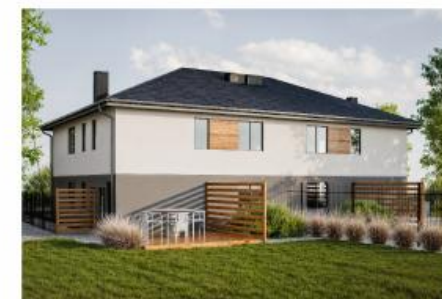
Widok budynku od tyłu